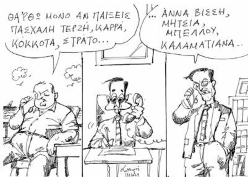
Ανδρέας Πετρουλάκης (Η ΚΑΘΗΜΕΡΙΝΗ)