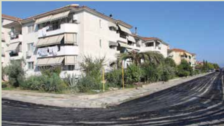
Ενα χρόνο μετά ελάχιστα πράγματα άλλαξαν για τους πλημυροπαθείς της Γιάννουλης...